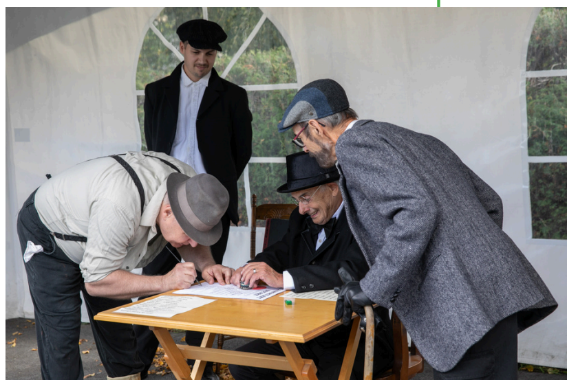
La pièce de théâtre humoristique « Léger Loubier fait des affaires », de la Société historique Saint-Benoît-Labre.